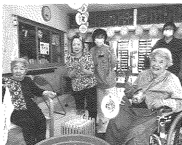
夏祭り 大物釣り大会