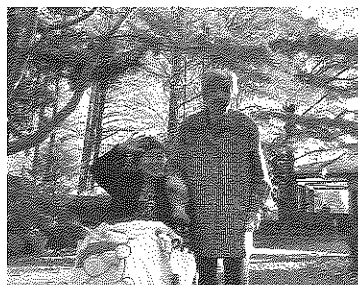
お出かけ紅葉散策