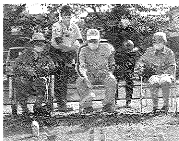
園庭でのレクリエーション運動

2024年7月には、介護海外人材も4名採用し、効率良い業務(生産性向上)へと取り組んでいます。今後もご利用者様には「満足」をご家族様には「安心」を、それぞれ理念として取り組み、全職員にとっても、やりがいのある職場環境とすることが最重要と考えます。